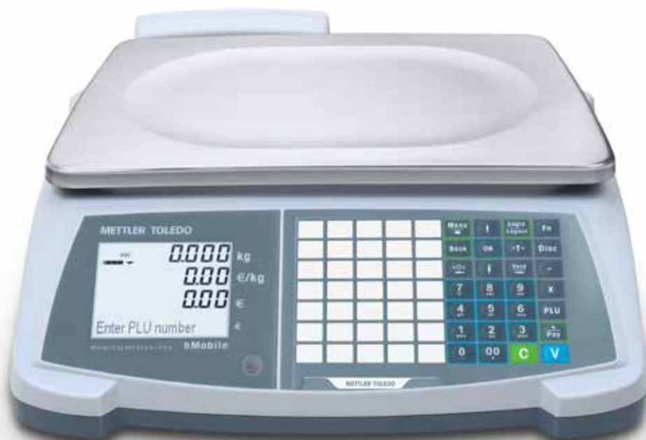
bMobile compacte weegschaal

Dankzij de snelle en nauwkeurige wegingen en functies is de bMobile van METTLER TOLEDO een economische en kostenefficiënte weegschaal voor het berekenen van prijzen, compleet met een ticketprinter die uw leven eenvoudiger maakt. Het is een functionele weegschaal, gebaseerd op onze jarenlange ervaring met toonaangevende weegschaaltechnologie.